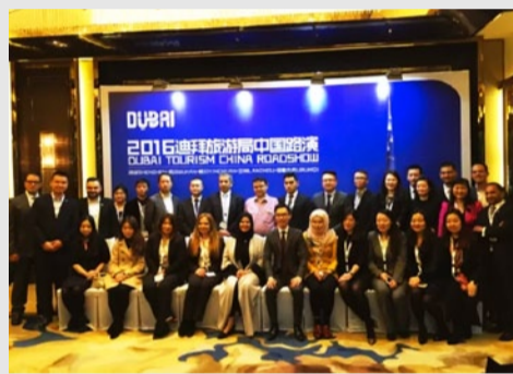
迪拜旅游局工作人员及展商合影

2016年，迪拜旅游局将在中国各大二线城市进一步拓展目的地宣传推广力度。同时，为了让广大消费者对迪拜旅游更加了解，迪拜旅游局也积极与各大媒体合作，扩大迪拜旅游宣传的深度与广度。2016年新年伊始，继《花儿与少年》的热播后，迪拜旅游局与浙江卫视合作拍摄的真人秀《24小时》迪拜站的节目已于2月19日上线，节目播出后，又引发一波迪拜热。