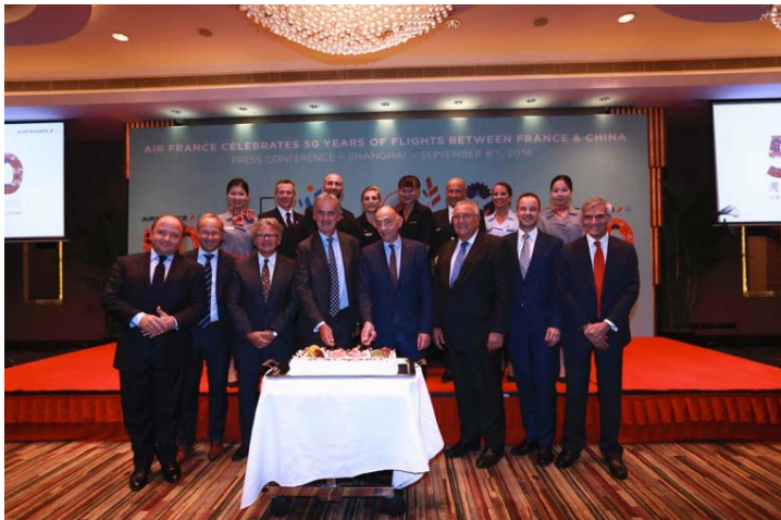
庆祝50周年法航领导与机组人员合影

们一直不断努力在中国航线上分享最具创新性的产品：全新客舱，个性化服务，专为中国乘客开发的产品以及最新机型等。我们必须继续这一势头，加强法航在大中国区的影响力。”