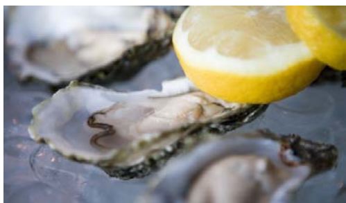
图为味道鲜美的牡蛎

康尼马拉与大西洋有着分不开的亲密关系，意味着海鲜在高威 (Galway) 美食文化中有着举足轻重的地位。三文鱼在手工熏制室熏制而成，而贻贝则在基拉里海港 (Killary Harbour) 的清澈水域中生长；高威湾 (Galway Bay) 本地牡蛎则拥有真正绝美的风味。