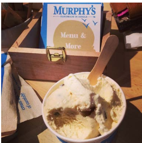
图为墨菲冰淇淋 (Murphy's Icecream)

丁格尔半岛 (Dingle Peninsula) 是一个满是甜食的乐园，斯凯利格巧克力公司 (Skelligs Chocolate) 正好俯瞰着凯里之环 (Ring of Kerry) 的圣菲尼安海湾 (St.Finian's Bay)。