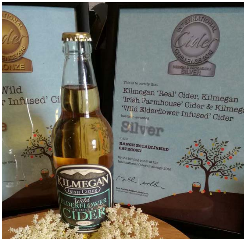
图为 Kilmegan 苹果酒

爱尔兰岛传统的小型酿酒厂比比皆是，酿造出美味又独特的精酿啤酒和苹果酒等等。Hilden, Boundary 以及 Sheelin 这些品牌，一定会让每对恋人印象深刻。Kilmegan 苹果酒的原材料主要来自于阿玛郡 (Co.Armagh)、蒂珀雷里郡 (Co.Tipperary) 以及北爱尔兰的唐郡 (Co.Down)。它是爱尔兰少有的仍在传统机架和布压机的苹果酒制造商，采用 100% 纯果汁发酵，再经过脱硫过程酿造出的独具风味的苹果酒。