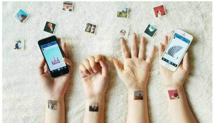
美国最受Instagram欢迎的目的地(节选前20名)

通过下面的表格, 你会看到美国各州最知名的两个景点以及全球“标签”率最高的目的地。