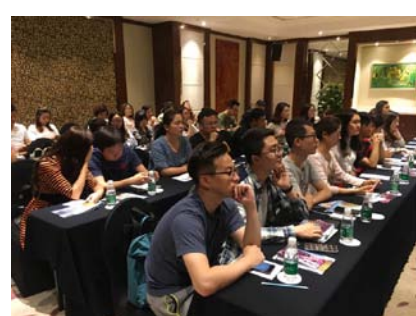
图为参会人员认真地听讲

会议现场，新西兰旅游局向与会同业分享了一组数据：根据新西兰统计局数字，截止2016年底，共有40万9千名游客到访新西兰，其中31万的是旅游度假游客；游客停留天数较2015年比，8-14天的涨幅最大，达到30.6%。而截止2016年底，江苏省到访客人是仅次于上海，北京，广州和浙江省，名列第五位。比2015年增长28.7%。新西兰旅游局负责人认为：此次培训会之所以选择在江苏南京举办，最重要的是看中了江浙沪市场的潜力。