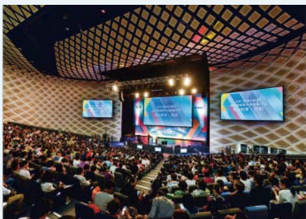
2017安利营销精英悉尼研讨会 本次安利(中国)海外研讨会由澳大利亚旅

2017年1月，来自安利(中国)的8,000多名业务精英在三周内分四批抵达悉尼，在这个迷人的海滨城市参加为期五天的营销精英海外研讨会。这是安利(中国)第六次选择澳大利亚，同时也是第三次选择悉尼作为公司海外研讨会的目的地。