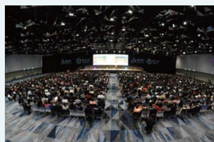
容纳千人的悉尼国际会议中心顶楼宴会厅