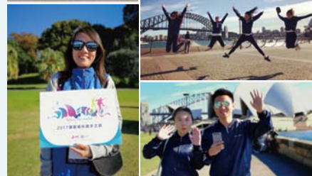
葆婴伙伴健康走活动