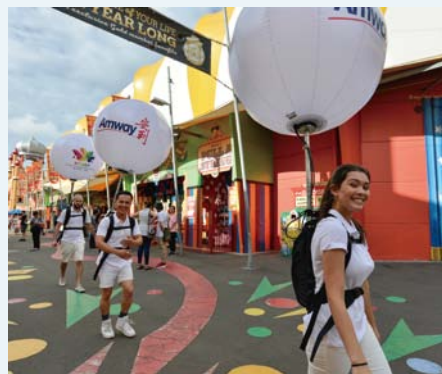
安利的伙伴们畅游悉尼

在五天的行程中，安利的营销精英们将游览包括悉尼海港大桥、悉尼歌剧院、悉尼水族馆海底世界、澳大利亚国家海事博物馆及悉尼塔等许多著名景点，还有机会亲身体验海豚巡游、滑沙，以及潜水等多姿多彩的冒险活动。活动结束之际，还品尝到月神公园专享庆祝晚宴提供的各式澳大利亚美酒佳肴。