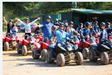
葆婴伙伴乐游布鲁克农场