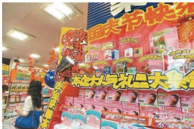
(日本美妆店打出的国庆促销，图片来源：参考消息)