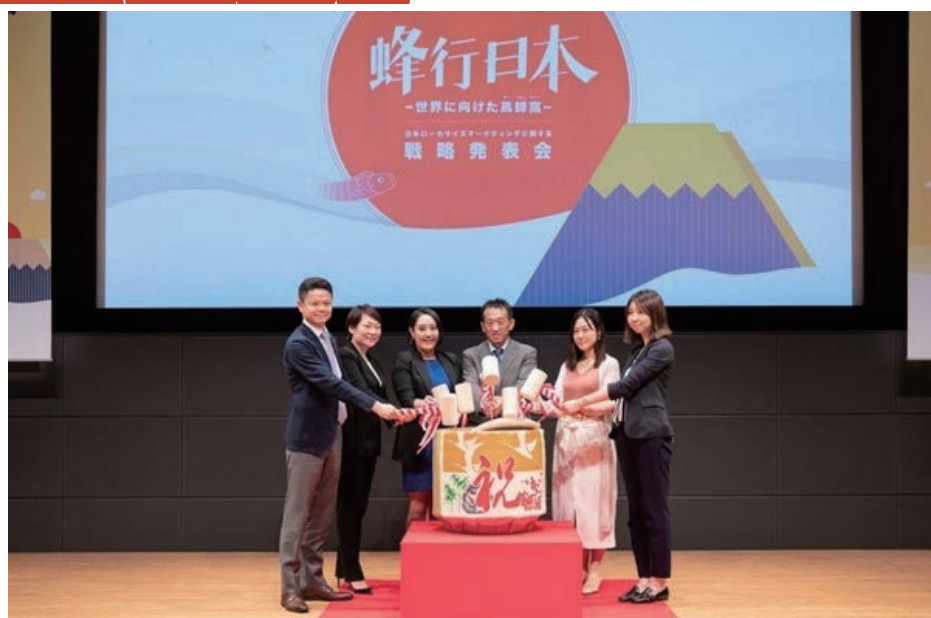
(马蜂窝日本发布会)

面对如此便利的通航与签证，各大旅游企业，也坐不住了，纷纷将日本选为布局国际旅游的第一站——