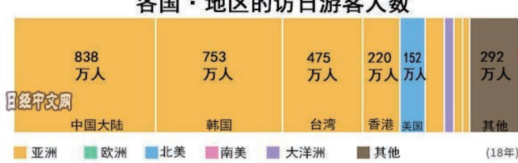
各国·地区的访日游客人数